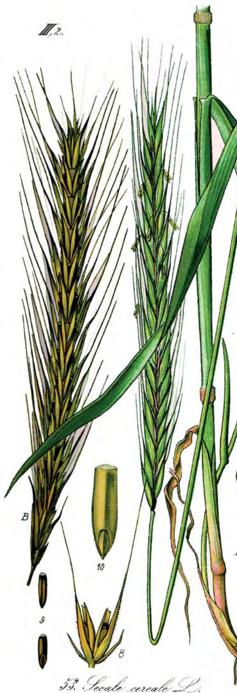
53. Secale cereale L.

La farina può essere aggiunta anche nella preparazione di gnocchi e altri prodotti da forno oppure nella preparazione del "sciughett", besciamella di segale che veniva cucinata come pappa per i bimbi.